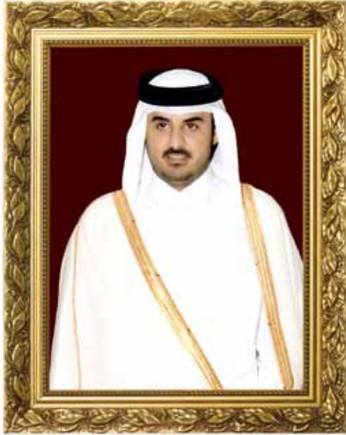
سمو الشيخ تميم بن حمد آل ثاني ولي العهد الأمين