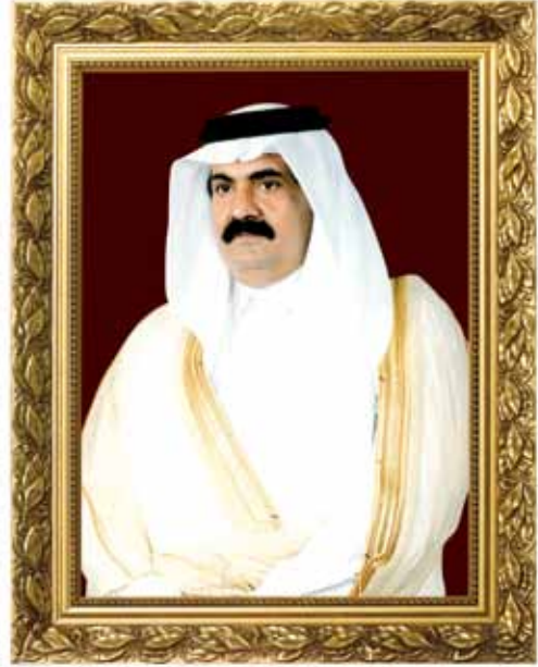
حضرة صاحب السمو الشيخ حمد بن خليفة آل ثاني أمير دولة قطر