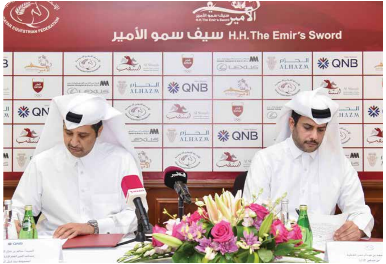
في إطار استراتيجيتها لدعم الرياضة في قطر ، وقعت مجموعة QNB اتفاقية مع الاتحاد القطري للفروسية (QEF) كراعٍ رئيسي لجميع الفعاليات التي ينظمها الاتحاد، بما في ذلك رعاية البنك لمهر جان سيف سمو الأمير .